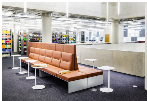
6 Zusammen mit jehs+laub entwickelte Brunner für die Universitätsbibliothek Freiburg eigens das modulare Loungemöbelsystem banc.