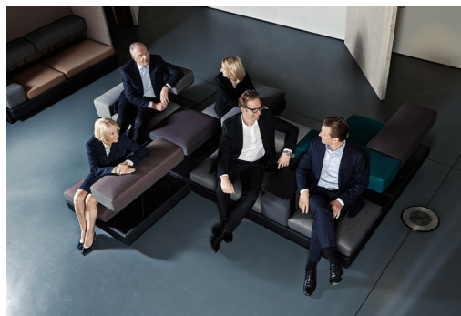
2 Familie Brunner führt das Unternehmen bereits in der zweiten Generation.