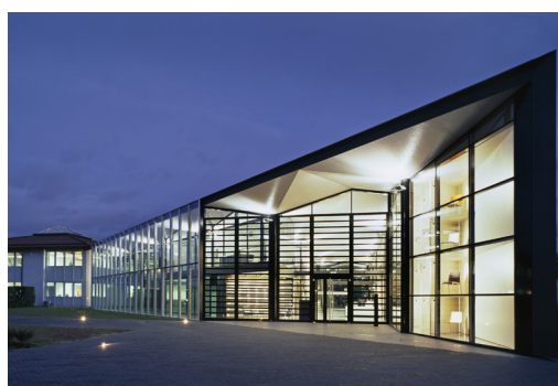
4 Am Heimatstandort Rheinau-Freistett baut Brunner 2016/17 ein neues Innovationszentrum sowie weitere Logistik- und Montageflächen.